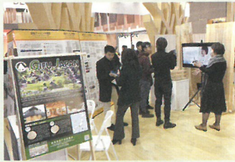
2019選材博覧会(中国・広州)