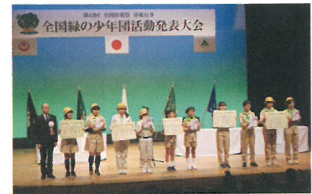
表彰(3番目が北方小学校)