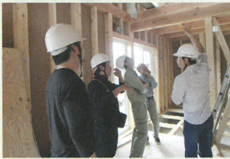
韓国技術者研修会(恵那市)

今後も、県内企業と販売力の優れた海外企業との連携に取り組み、付加価値の高い県産材製品の輸出を促進してまいります。