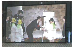
全国育樹祭でのみどりの贈呈 (ガジュマルの苗木)