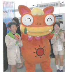
イーサー君といっしょに