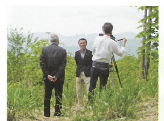
郡上漁業協同組合長の インタビュー