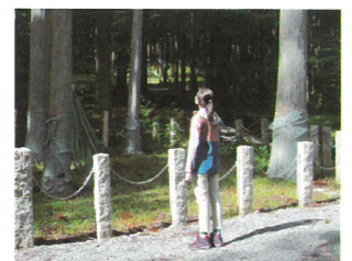
天皇林のスギの木を見上げて