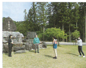
取材の様子 (揖斐川町・県緑推)