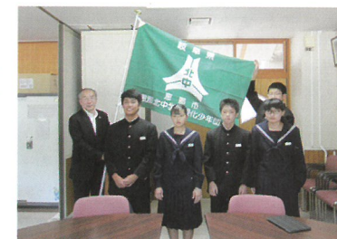
恵那北中学校緑化少年団

県内には、67団、約5,000人の小・中学生がみどりの少年団として活動しています。新型コロナウイルス感染症拡大防止から、活動に制約を受けていると思いますが、団員みんなで力を合わせて活動をやり遂げ、緑を愛する人に育ってほしいと願っています。