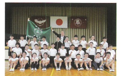
武並小学校みどりの少年団