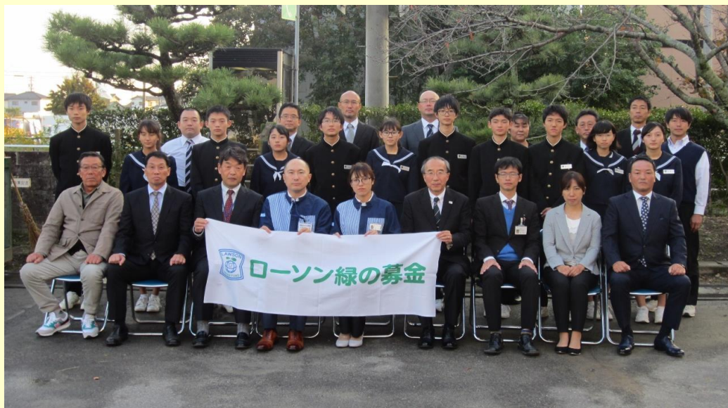
羽島中学校の生徒と出席者の皆さん