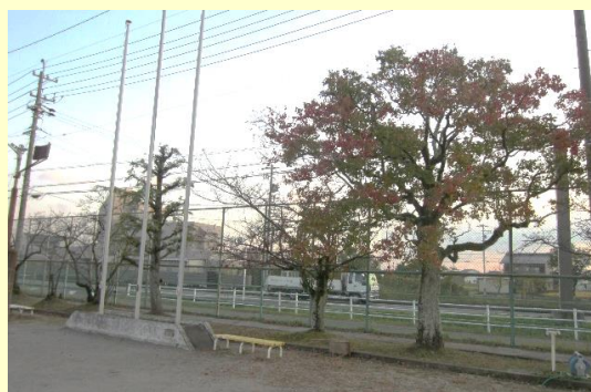
剪定された樹木たち